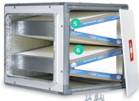
Perfect 16™ micro-fibers